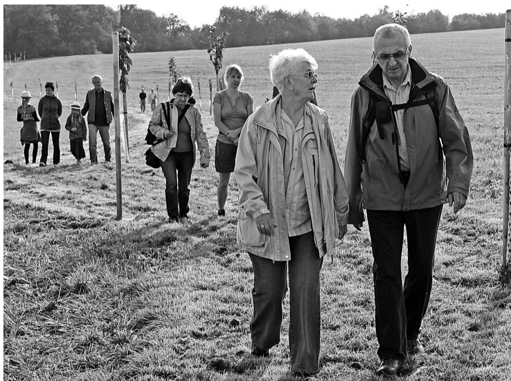
ALEJ do rokle Kačina je vysázena ze stromků tradičních ovocných odrůd. Začíná i končí třešněmi.

Alej tradičních ovocných stromů, kterou zahajují a zakončují vzrostlejší třešně, vede nejdříve do rokle Kačina, kde mohou turisté pokračovat do Brusné a dál na Housku, nebo se vydají na cestu až do