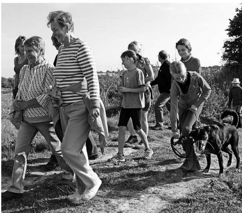
SLAVNOSTNÍHO otevření cest se zúčastnilo asi třicet lidí.